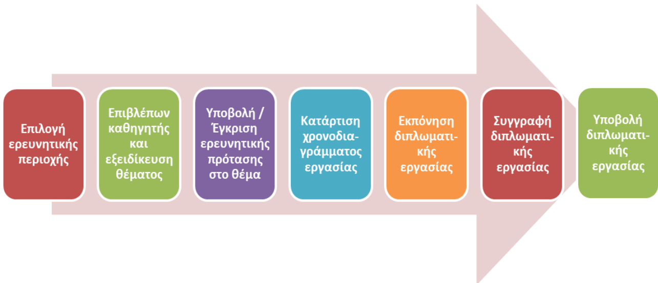
Σχήμα 1. Διαδικασία Κατάρτισης ΔΕ

Αρχικά οι φοιτητές καλούνται να πάρουν δύο σημαντικές αποφάσεις.